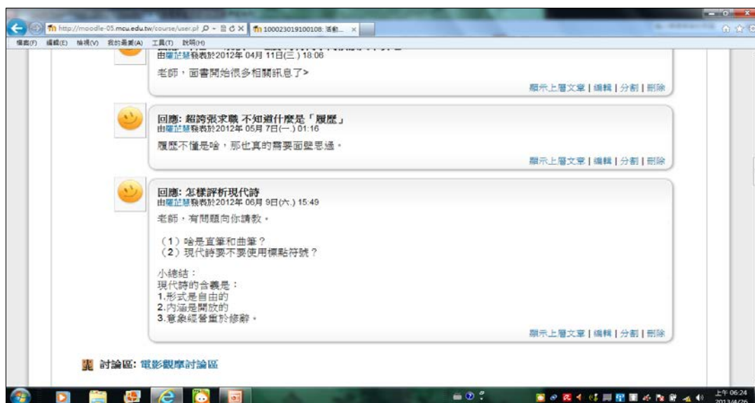
圖1.國文教學於Moodle討論區之實例

銘傳大學所設立之 Moodle 教學平台，是一個具備多方面功能，甚至可說是全方位功能之平台，包括教學資源檔案之整理、每週課程進度、交作業、行事曆、重要訊息 (公佈欄)、討論區、線上測驗題、私人簡訊……等等。如果師生善加利用，能夠確切掌握課程資訊，非常方便。以國文教學之實例而言，當課堂上談論到某篇文章或某種文學體裁之撰寫，學生可於討論區寫下心得與提出問題，以圖 1.國文教學於 Moodle 討論區之實例說明，例如學生寫下對於求職履歷之簡單心得，與提出有關於現代詩之問題。此則討論區之前，教師已於課堂講解自傳、履歷表之撰寫，與評析現代文學，教師與學生可視情形於 Moodle 討論相關問題，如此能夠增加學生學習興趣，達到良好之教學成效。