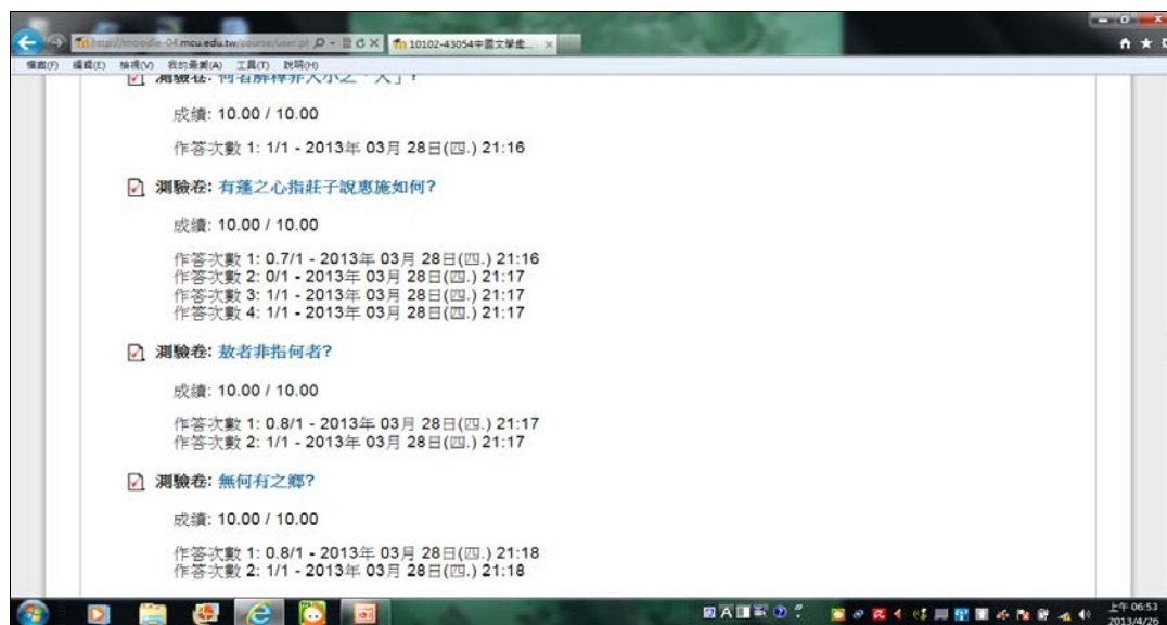
圖2.國文教學於Moodle測驗卷之實例

現「有蓬之心」，指的是莊子與惠施有關於一事物使用方法的對答中，莊子認為惠施的說法，心靈茅塞不通。學生是否真正理解其意義，可以藉由測驗題之作答情形，看出作答次數、成績結果，如此能夠確實並且即時地掌握學生學習結果，若有需要則再加強輔導，俾使達到良好之學習成效。