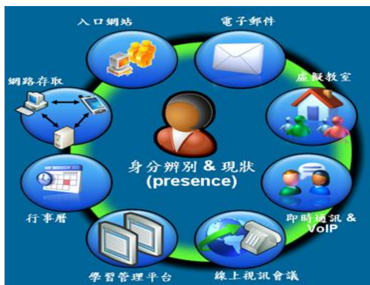
圖1 數位系統整合環境

本校在 20 年前，即奉李校長的指示將全校的系統數位化，並全部整合在一起。每個校區都成立主控室，負責全校網路、電話、視訊、以及有線電視系統的整合。在這樣基礎建設的架構之上，逐步將 e 化校園的概念推行出去。整體的 e 化校園，是結合了各種的相關系統及技術，包括了入口網站、電子郵件、虛擬教室、即時通訊 & VoIP、線上視訊會議、學習管理平台、行事曆、網路存取、身分辨別 & 現狀 (presence) 等。整合 e 化校園環境架構如圖 1 所示。