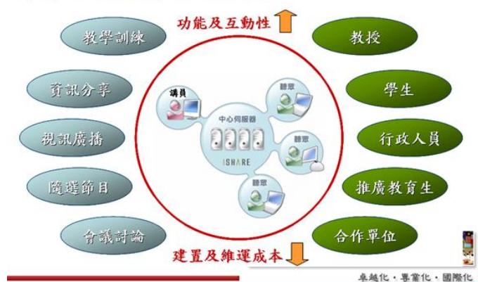
圖2 數位系統整合環境